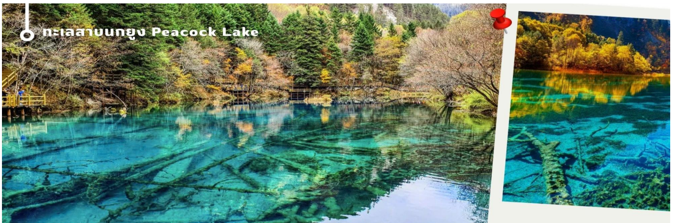
ทะเลสาบนกยูง Peacock Lake

ทะเลสาบมีรูปร่างคล้ายกับนกยูง จึงเป็นที่มาของชื่อ แม้พื้นที่จะไม่กว้างมากนัก มีความยาวเพียงแค่ 310 เมตร แต่ความสวยงามของที่นี่ก็ไม่แพ้จุดอื่นๆ ของอุทยานฯ เพราะน้ำในทะเลสาบเป็นสีฟ้าใสราวกับคริสตัล โฉมเฉดฟ้าอ่อนฟ้าอมเขียว และน้ำเงินตามความตื้นลึกของน้ำ ในช่วงฤดูหนาวต้นไม้จะถูกปกคลุมไปด้วยหิมะสีขาวนวล ดูแล้วคล้ายนกยูงกำลังจ้ำจี้ หากมาในช่วงที่มีแสงแดดจะมองเห็นความงดงามได้ทั่วบริเวณ