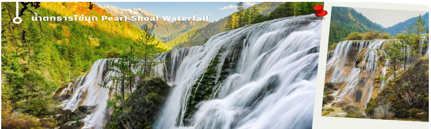
น้ำตกธารไข่มุก Pearl Shoal Waterfall

3.น้ำตกธารไข่มุก (Pearl Shoal Waterfall) หรือ น้ำตกนุริอกลาง (Nuo Ri Lang Waterfall) ถือเป็นน้ำตกที่ใหญ่ที่สุดในจิวจ้ายโกว มีความสูง 40 เมตร กว้าง 310 เมตร เกิดจากหินปูนที่แข็งตัวจนกลายเป็นรูปทรงคล้ายพัด มีสายธารน้อยใหญ่ไหลผ่านลดหลั่นทอดยาวผ่านชั้นหินต่างๆ ยามมีแสงแดดสาดส่องตกลงกระทบผิวน้ำจะส่องประกายราวกับเส้นไข่มุกเหมือนชื่อน้ำตก บางครั้งอาจได้เห็นสายรุ้งจากแสงแดดที่สะท้อนกับละอองน้ำอีกด้วย หากได้มาในช่วงฤดูหนาว ก็จะเห็นหิมะเกาะตามต้นไม้ โขดหิน และถ้าอากาศหนาวมากๆ น้ำที่น้ำตกก็จะกลายเป็นน้ำแข็ง กลายเป็นประติมากรรมจากธรรมชาติที่สวยงาม