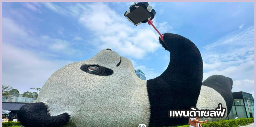
แพนด้าเชลฟี

จากนั้นนำท่านชม จัตุรัสหยางเทียนหวู่ นำท่านถ่ายกับรูปปั้นผลงานศิลปะ รูปปั้นแพนด้าถ่ายเชลฟี ที่ตั้งอยู่กลางจัตุรัสสุดน่ารัก ซึ่งออกแบบโดยนักออกแบบชื่อดัง FLORENTIJN HOFMAN หมีแพนด้าตัวนี้มีความยาว 26 เมตร กว้าง 11 เมตร สูง 12 เมตรและหนัก 130 ตัน อยู่ในท่านอนหงายบน