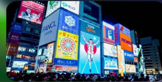
ซูปป์ิงชินโซบาชิ