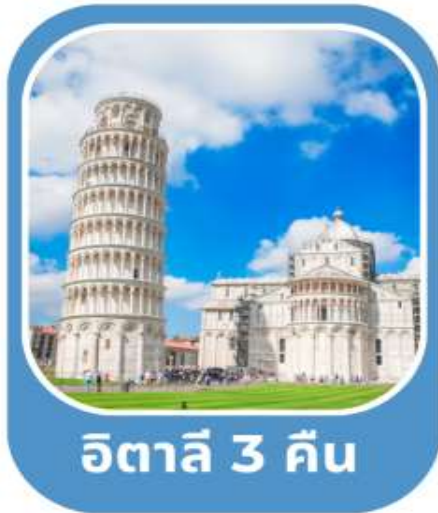
อิตาลี 3 คืน

โรม•นครรัฐวาติกัน•มหาวิหารเซ็นต์ปีเตอร์•โคลอสเซียม•น้ำพุเทรวี่•บันโดสเปน มอนเตคาดีนี•ปีซ่า•หอเอนเมืองปีซ่า•ล่องเรือเกาะเวนิส•ชมเมืองมิลาน•อินเทอร์ลาเคน เลาเทอร์บรุนเนน•พีชิตยอดเขาจุงเฟร่า•ชมเมืองลูเซิร์น•ดีจอง•ปารีส เข้าชมพระราชวังแวร์ซายย์•ล่องเรือชมแม่น้ำแซนน์•ช้อปปิ้ง•มองมาร์ต