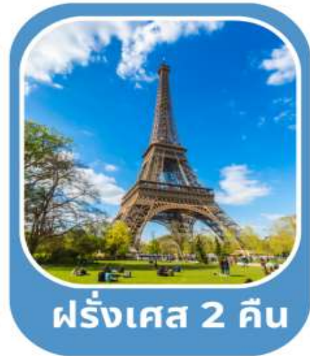
ฝรั่งเศส 2 คืน