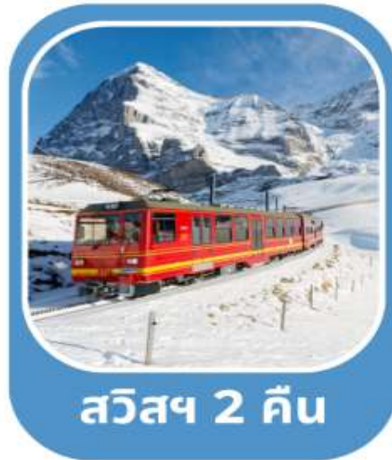
สวิสฯ 2 คืน