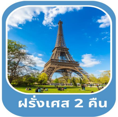
ฝรั่งเศส 2 คืน