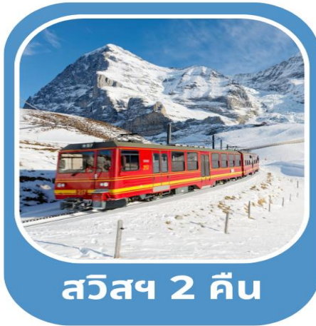
สวิสฯ 2 คืน