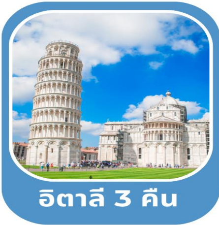
อิตาลี 3 คืน

โรม•นครรัฐวาติกัน•มหาวิหารเซนต์ปีเตอร์•โคลอสเซียม•น้ำพุเทรวี•บันไดสเปน มอนเตคาดีนี•ปีซ่า•หอเอนเมืองปีซ่า•ล่องเรือเกาะเวนิส•ชมเมืองมิลาน•อินเทอร์ลาเคน เลาเทอร์บรุนเนน•พีชิตยอดเขาจุงเฟรา•ชมเมืองลูเซิร์น•ดีจอง•ปารีส เข้าชมพระราชวังแวร์ซายย์•ล่องเรือชมแม่น้ำแซนน์•ช้อปปิ้ง•มองมาร์ต