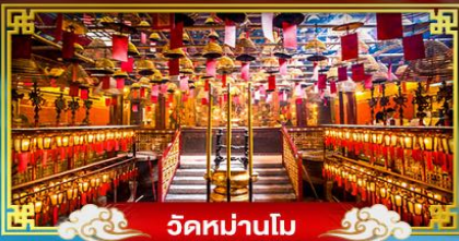
วัดหม่านโม