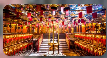
วัดหม่านโม