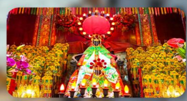
วัดเจ้าแม่กวนอิมสองอำเภอ