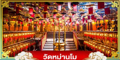
วัดหม่านโม