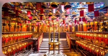
วัดหม่านโม