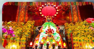
วัดเจ้าแม่กวนอิมสองอำเภอ