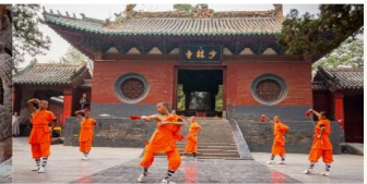
ชมโชว์กังฟูเล่าหลิน

*ทางบริษัทฯ ขอสงวนสิทธิ์ในการสลับโปรแกรมทัวร์ตามความเหมาะสมขึ้นอยู่กับสถานการณ์หน้างาน โดยคำนึงถึงผลประโยชน์ของลูกค้าเป็นสำคัญ