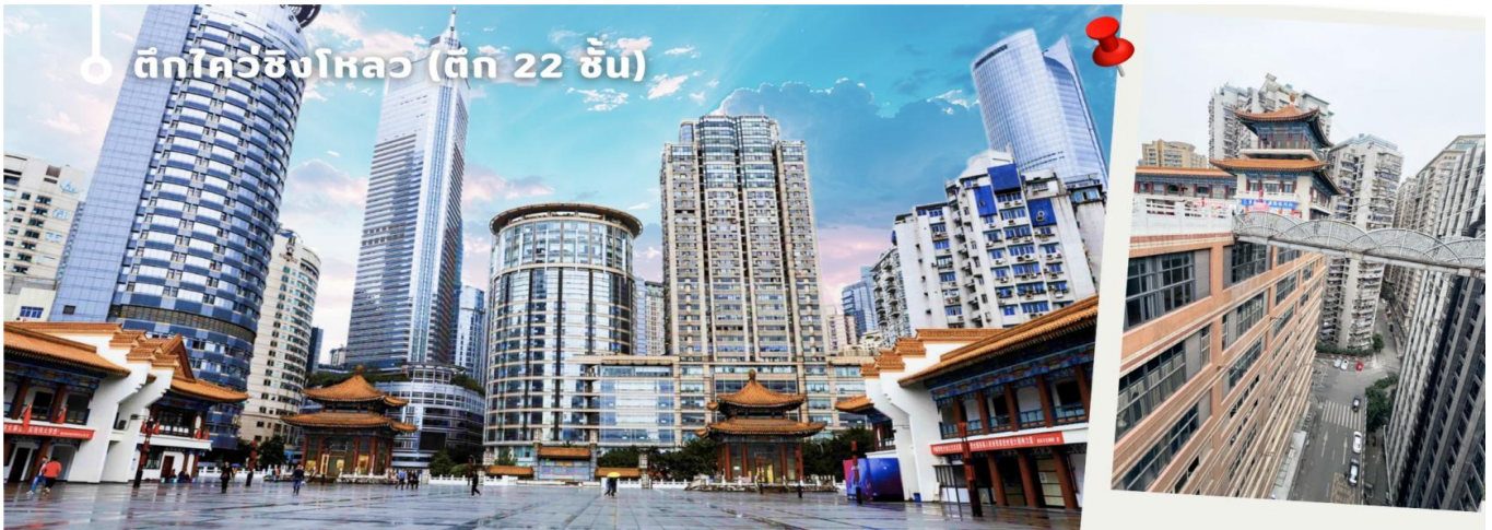
ตึกไควฮิงโหลว (ตึก 22 ชั้น)

เป็นอาคารที่มีลักษณะพิเศษที่เมืองฉงชิ่ง ประเทศจีน เนื่องจากภูมิประเทศที่เป็นภูเขา อาคารแห่งนี้จึงมีทางเข้าใน ระดับที่ต่างกัน เป็นจุดถ่ายรูปและชมวิวที่โดดเด่นของเมืองฉงชิ่งที่ได้ชื่อว่าเป็น "เมืองสามมิติ"