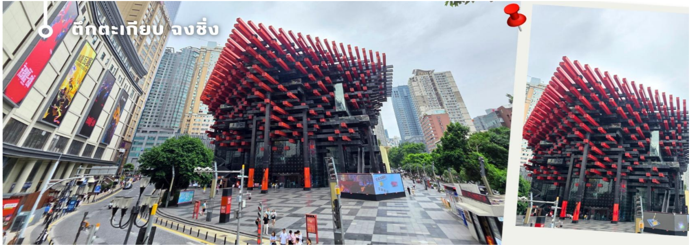
📍 ตึกตะเกียบ จงชิ่ง

เอกลักษณ์ อาคารนี้ถูกวางโครงสร้างให้มีรูปร่างคล้ายกอง "ตะเกียบยักษ์" สีดำและแดงที่วางซ้อนกันเป็นชั้นๆ ที่ส่วนปลายของตะเกียบสีแดงจะมีตัวอักษรจีนคำว่า "กั๋ว" ประทับอยู่ ซึ่งมีความหมายถึง ชาดีหรือประเทศ ส่วนที่ปลายตะเกียบสีดำ จะมีอักษรจีนคำว่า "ไท่" ประทับอยู่ ซึ่งหมายถึง ความเจียบสงบ หรือความอุดมสมบูรณ์