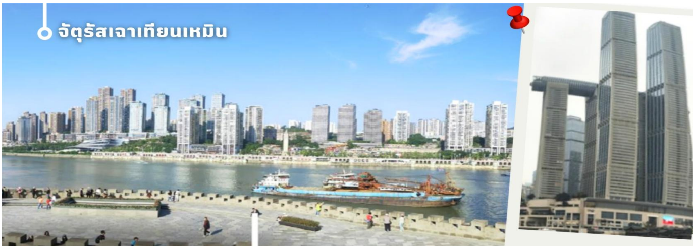
จัตุรัสเฉาเทียนเหมิน

จากนั้น นำท่านเดินทางสู่ จัตุรัสเฉาเทียนเหมิน ซึ่งตั้งอยู่ ณ จุดบรรจบของ แม่น้ำแยงซี และ แม่น้ำเจียหลิง นับเป็น ท่าเรือขนส่งทางน้ำที่ใหญ่ที่สุดของนครฉงชิ่ง และเป็นศูนย์กลางการค้าสำคัญมาอย่างยาวนาน บริเวณนี้ยังเป็นที่ตั้ง ของ ตลาดการค้าครบวงจรเฉาเทียนเหมิน ซึ่งถือเป็นตลาดขนาดใหญ่ที่สุดของฉงชิ่ง ทำให้พื้นที่โดยรอบเต็มไปด้วย ผู้คนและมีชีวิตชีวาอยู่เสมอ ตั้งแต่อดีตจนถึงปัจจุบัน จัตุรัสแห่งนี้ได้รับการออกแบบให้มีลักษณะคล้ายเรือยักษ์ที่ กำลังแล่นออกสู่สายน้ำอย่างสง่างาม จึงได้รับสมญานามว่า “โททานิคแห่งฉงชิ่ง” เมื่อยืนอยู่บนจัตุรัส ท่านจะ สามารถมองเห็นภาพอันน่าประทับใจของจุดบรรจบระหว่างแม่น้ำสองสาย โดยน้ำสีเหลืองของแม่น้ำแยงซีและน้ำสี เขียวมรกตของแม่น้ำเจียหลิงไหลมาบรรจบกันอย่างชัดเจน สร้างทัศนียภาพที่สวยงามและเป็นเอกลักษณ์ของฉงชิ่ง อย่างแท้จริง