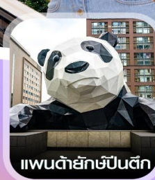
แพนด้ายักษ์ป็นติก