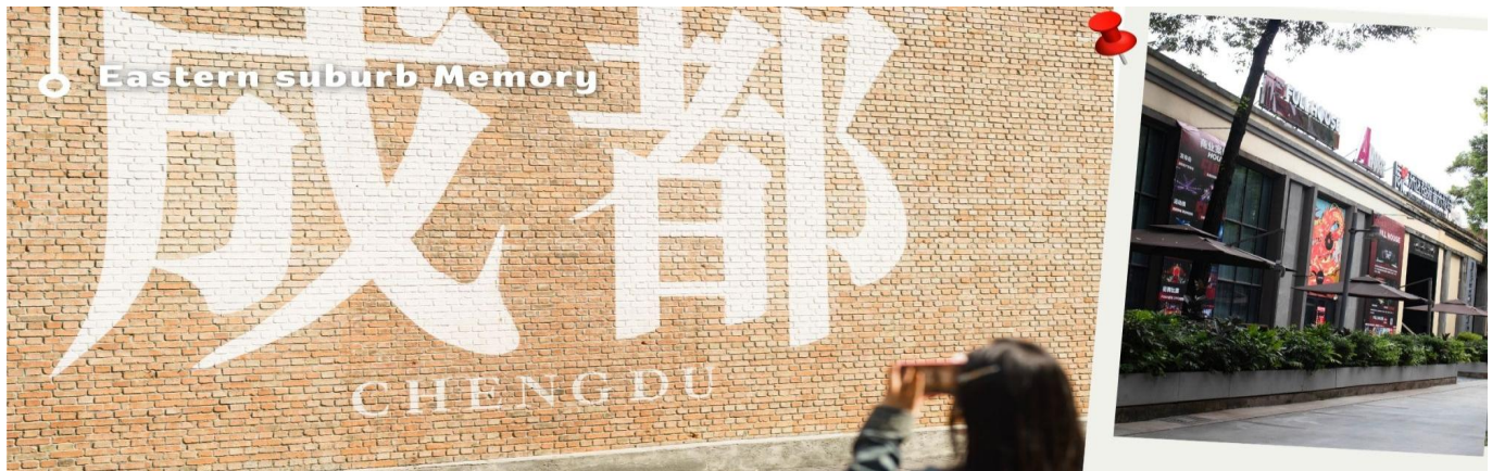
📍 Eastern suburb Memory

หลังอาหารเช้า เดินทางกลับเฉิงตู นำท่านเดินทางไปชดเช็คอิน ของวัยรุ่นเจ้าถิ้น เฉิงตู “ตงเจียว เจี้ยว” 东郊记忆 (Eastern suburb Memory) ที่มีทั้งแกลลอรี่ ร้านอาหาร คาเฟ่ น่ารักๆ มากมาย และร้านเสื้อผ้า ร้านค้าเล็กๆ ให้เราได้เดินช้อปปิ้งเพลินๆ แลรมีจุดถ่ายรูป ตลอดทั้งถนน และร้านอาหาร