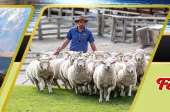
วอลเตอร์ฟิคฟาร์ม