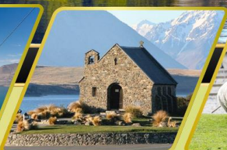
ทะเลสาบเทคาโป