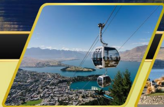
นั่งกระเช้าคอนโดล่า