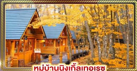
หมู่บ้านนิงเกิลออเรน