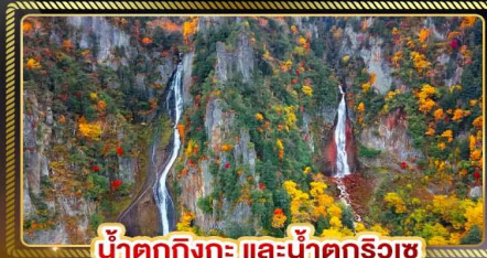
น้ำตกกิงกะ และน้ำตกริวเซ