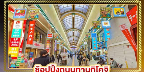
ช้อปปิ้งถนนทานุกิดโจ