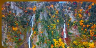
น้ำตกคิงกะ และน้ำตกริวเซ