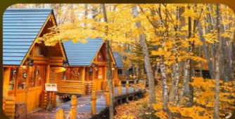
หมู่บ้านนิงเกิ้ลทอเรซ