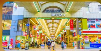
ซุปป์ิงถนนทากุกิโคจิ