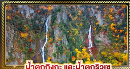
น้ำตกกิงกะ และน้ำตกริวซุ