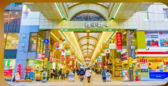
ซุปป์ิงถนนทากูกิโคจิ