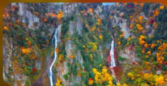
น้ำตกกิงกะ และน้ำตกริวเซ