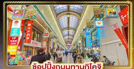
ช้อปปิ้งถนนทานุกุโจ