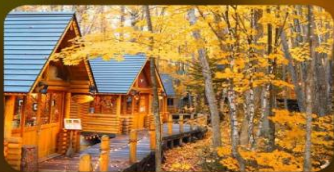
หมู่บ้านนิงเกิลทอเรซ