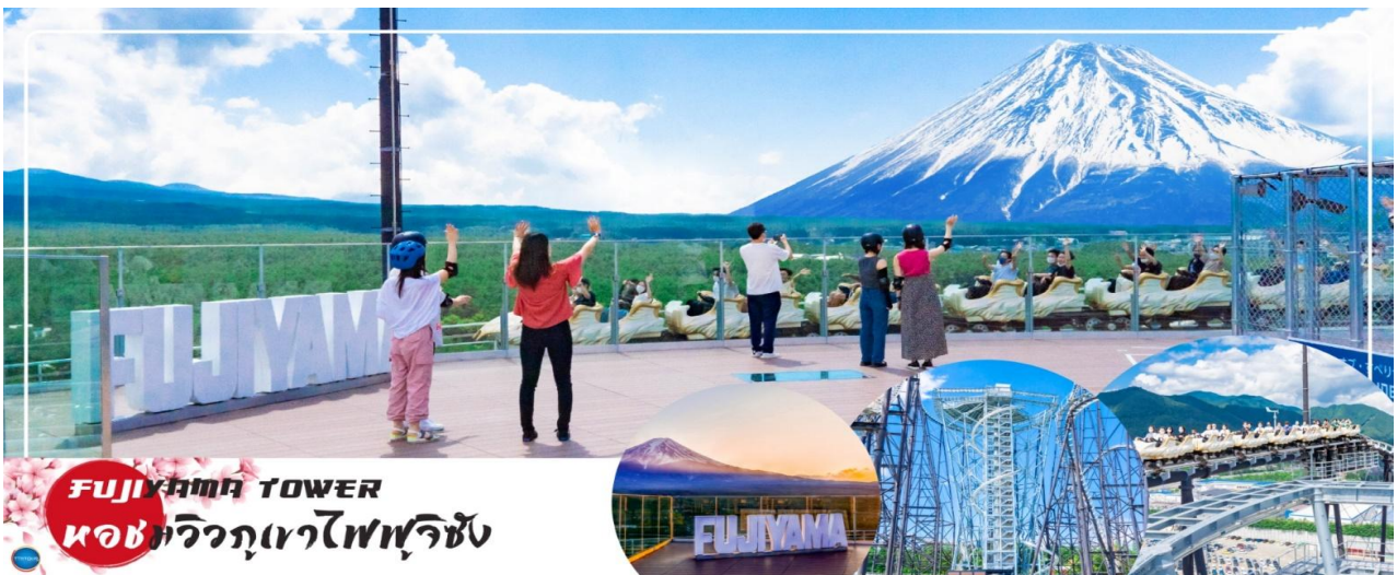
FUJIYAMA TOWER หอคอยวิวภูเขาไฟฟูจิ

ในบริเวณเดียวกันนำท่านสู่ FUJIYAMA TOWER เป็นหอคอยชมวิวที่ทางสวนสนุก Fuji-Q Highland สร้างขึ้นเนื่องในโอกาสที่รถไฟเหาะ Fujiyama ครบรอบ 25 ปี โดยสร้างขึ้นที่ด้านในส่วนโค้งของรางรถไฟเหาะ Fujiyama ซึ่งเป็นจุดที่สามารถมองเห็นวิวของภูเขาไฟฟูจิได้เต็มตา หอคอยชมวิวแห่งนี้มีความสูงอยู่ที่ 55 เมตร โดยบริเวณชั้นบนสุดของหอคอยได้ถูกสร้างเป็นดาดฟ้าชมวิวแบบ 360 องศา ซึ่งมีชื่อว่า "Fujiyama Sky Deck Observatory" สามารถขึ้นไปเพื่อชมวิวของภูเขาไฟฟูจิได้โดยไม่ต้องนั่งรถไฟเหาะ นอกจากนี้ภายในหอคอยยังมีกิจกรรมสำหรับผู้ชื่นชอบความหวาดเสียว นั่นก็คือ "Fujiyama Walk" ซึ่งเป็นทางเดินวงกลมรอบหอคอยที่ไม่มีราวจับ จะมีก็เพียงสายรัดที่ยึดเอาไว้กับตัวเท่านั้น และอีกอย่างคือ "Fujiyama Slider" สไลเดอร์แบบท่อที่จะสไลด์ลงจากชั้นดาดฟ้าชมวิวลงสู่พื้นดิน