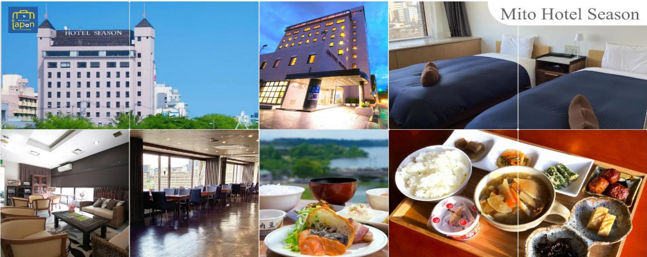
Mito Hotel Season

เย็น รับประทานอาหารเย็น ณ ภัตตาคาร (1) พักที่ MITO HOTEL SEASON, IBARAKI หรือระดับเดียวกัน