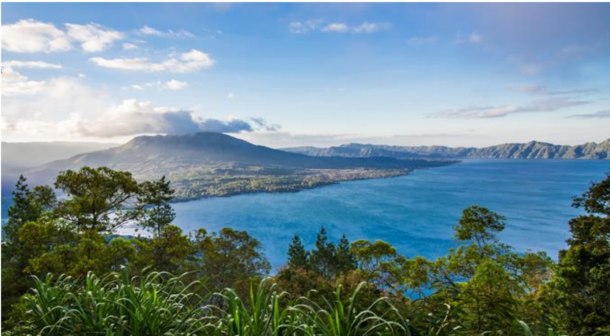
กลางวัน ☉ รับประทานอาหารกลางวัน ณ ภัตตาคาร อาหารพื้นเมืองแบบบาหลีบุฟเฟ่ต์ ณ ภัตตาคารลอยฟ้า ท่ามกลางหุบเขา อากาศเย็นตลอดปี LAKE VIEW

จากนั้นเดินทางขึ้นสู่ เทือกเขา Kintamani เป็นพื้นที่ท่องเที่ยวชื่อดังทางตอนเหนือของเกาะบาหลี ประเทศอินโดนีเซีย โดดเด่นด้วยทิวทัศน์ธรรมชาติอันงดงามของ ภูเขาไฟบาตอร์ (Mount Batur) ที่ยังคงมีพลัง พร้อมกับทะเลสาบบาตอร์ (Lake Batur) ซึ่งเป็นทะเลสาบน้ำจืดขนาดใหญ่ ตั้งอยู่ท่ามกลางหุบเขาและภูเขาสูง บรรยากาศเย็นสบายตลอดปี เหมาะแก่การพักผ่อนและชมวิวแบบพาโนรามา พื้นที่คันทันยังมีเป็นแหล่งเพาะปลูกกาแฟที่มีชื่อเสียง โดยเฉพาะ กาแฟขี้ชะมด (Kopi Luwak) กาแฟขึ้นชื่อระดับโลก นักท่องเที่ยวสามารถเยี่ยมชมสวนกาแฟ เรียนรู้ขั้นตอนการผลิต ตั้งแต่การปลูก การคัดเลือกเมล็ด ไปจนถึงการชิมกาแฟสด ๆ พร้อมชมวิวภูเขาไฟและทะเลสาบที่สวยงาม เป็นประสบการณ์ที่ผสมผสานทั้งธรรมชาติ วัฒนธรรม และวิถีชีวิตท้องถิ่นได้อย่างลงตัว