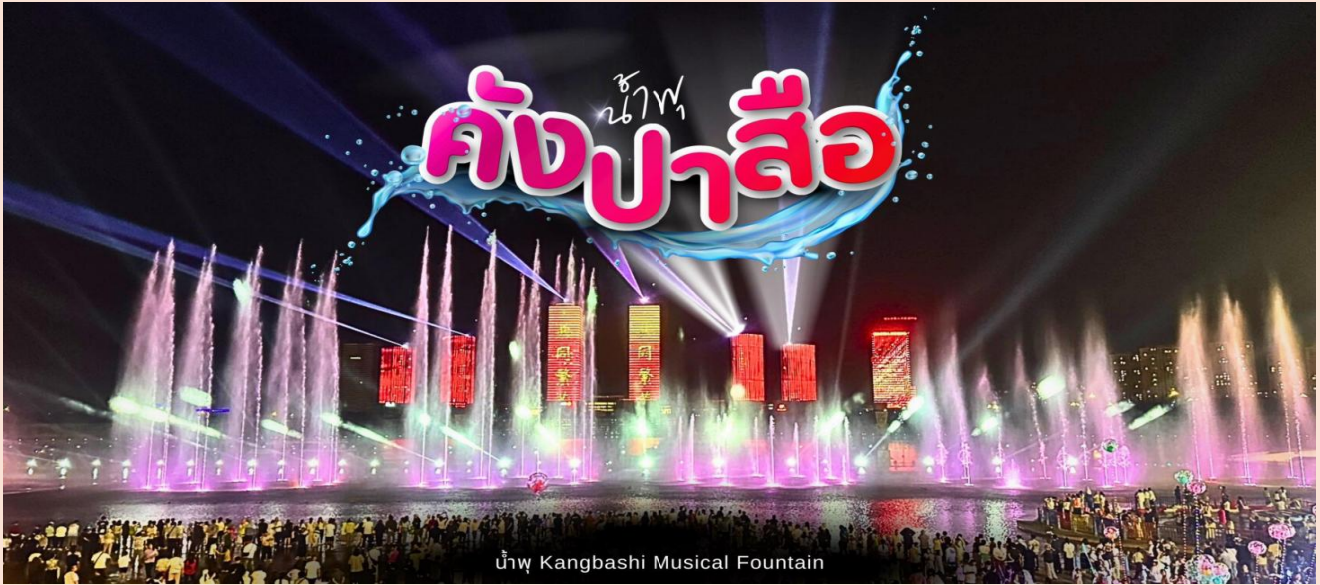
น้ำพุ Kangbashi Musical Fountain

ที่พัก HOLIDAY INN EXPRESS HOTEL หรือระดับเทียบเท่า 4 ดาว