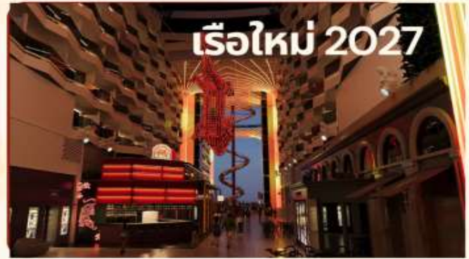
เรือใหม่ 2027