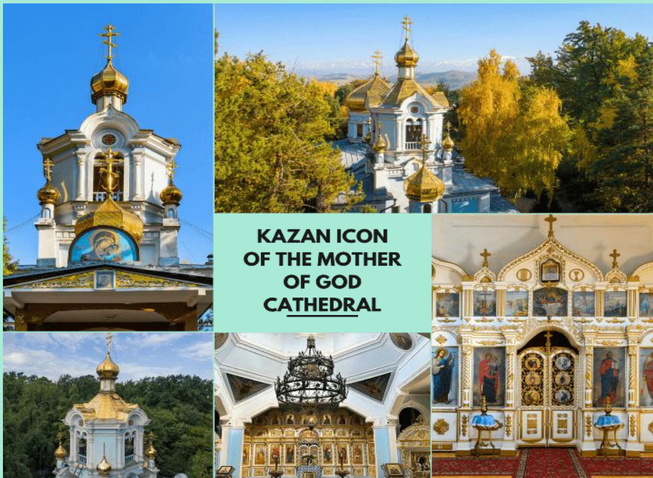
KAZAN ICON OF THE MOTHER OF GOD CATHEDRAL

นำท่านชม โบสถ์ไต่ดินคาซาน (Kazan Icon of the Mother of God Cathedral) สภาที่ศักดิ์สิทธิ์ลึกลับไต่ดินแห่งเมืองอัลมาตีถูกซ่อนอยู่ในถ้ำไต่ดิน สร้างขึ้นโดยฝีมือช่างชาวรัสเซียในช่วงต้นศตวรรษที่ 20 เพื่อเป็นสถานที่ประกอบพิธีกรรมทางศาสนา ด้านโบสถ์ตกแต่งด้วยภาพจิตรกรรมของชาวคริสต์นิกายออร์ทอดอกซ์ บรรยากาศเย็นสงบ และเต็มไปด้วยยมนต์ขลัง ( การเปลี่ยนสีของใบไม้ขึ้นอยู่กับสภาพอากาศ )