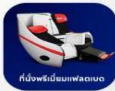
ที่นั่งพรีเมียมเฟลตบอ