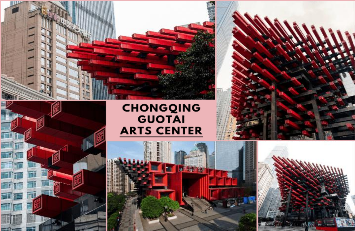
CHONGQING GUOTAI ARTS CENTER

จากนั้นนำท่านสู่ ตึกตะเกียบ (Chongqing Guotai Arts Center) แลนด์มาร์กดีไซน์ล้ำสมัย เป็นสิ่งก่อสร้างอันมีเอกลักษณ์ อาคารนี้ถูกออกแบบให้มีรูปร่างคล้ายกอง “ตะเกียบยักษ์” สีดำ และแดงที่วางซ้อนกันเป็นชั้น ๆ สร้างความประทับใจให้กับผู้พบเห็นตั้งแต่แรกเห็น นอกจากนี้จะเป็นสัญลักษณ์ที่โดดเด่นแล้ว ยังเป็นศูนย์รวมงานศิลปะที่สำคัญ มีการจัดแสดงนิทรรศการศิลปะหลากหลายประเภท ทั้งภาพวาด ประติมากรรม และการแสดงต่าง ๆ สะท้อนถึงความคิดสร้างสรรค์ และการผสมผสานระหว่างวัฒนธรรมจีนดั้งเดิมกับความทันสมัยได้อย่างลงตัว ตึกตะเกียบจึงเป็นสัญลักษณ์แห่งความภาคภูมิใจ ความเป็นเอกลักษณ์ของเมืองจงซึ่งที่นำมาเยือน และชื่นชมอย่างยิ่ง