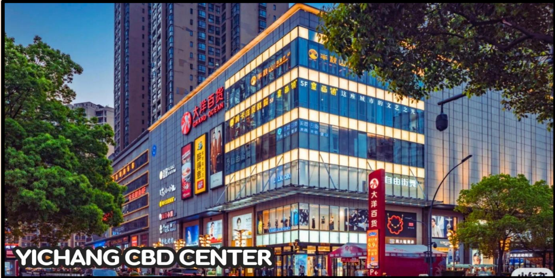
YICHANG CBD CENTER

จากนั้นเดินทางไปยังเมืองอี้ชาง (ใช้เวลาเดินทาง 3.30 ชั่วโมง) และนำทุกท่านไปยังย่านเศรษฐกิจของเมืองอี้ชาง Yichang CBD Center เป็นศูนย์กลางธุรกิจดั้งเดิมที่มีความคึกคัก เต็มไปด้วยห้างสรรพสินค้า ของที่ระลึก ร้านอาหารมากมาย เดินทางสะดวกใกล้จัตุรัส Yilingเหมาะสำหรับการช้อปปิ้งและหาของกินพื้นเมือง มีห้างสรรพสินค้า CBD Shopping Center ซึ่งเป็นที่ตั้งของซูเปอร์มาร์เก็ตขนาดใหญ่อย่าง Wal-Mart และร้านค้าแบรนด์เนมต่างๆ ด้านหลังศูนย์การค้ามี ถนนคนเดิน (CBD Night Market) ซึ่งเป็นแหล่งรวมสตรีทฟู้ดขึ้นชื่อ เช่น (เกี้ยวหัวโซเท้าทอด) และเครื่องดื่มท้องถิ่นอย่าง(เหลียงเซี่ย)