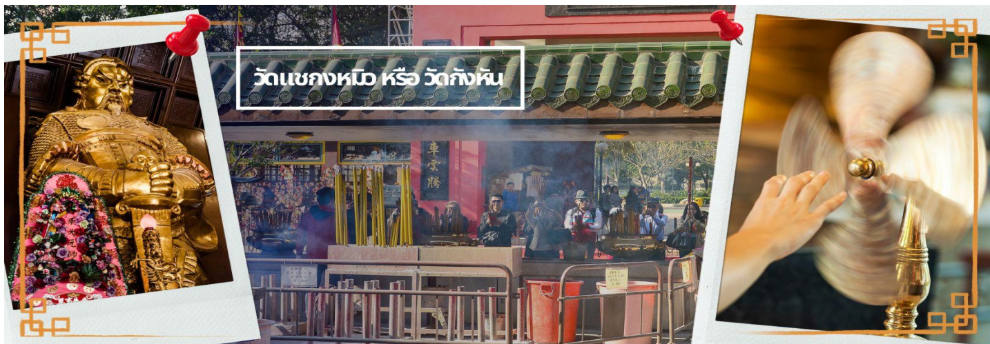
วัดเข่งหม้อ หรือ วัดกัณฑ์

การงาน โชคลาภ ยศศักดิ์ และถ้าหากคนที่ดวงไม่ดีมีเคราะห์ร้ายก็ถือว่าเป็นการช่วยหมุนปิดเปาเอาสิ่งร้ายและไม่ดีออกไปให้หมด ในองค์กัณฑ์หน้าโชคมี 4 ใบพัด คือพร 4 ประการ ได้แก่ สุขภาพร่างกายแข็งแรง, เดินทางปลอดภัย, สมความปรารถนา และเงินทองไหลมาเทมา ในทุกๆวันที่ 2 ของเดือนแรกตามปฏิทินจีนชาวฮ่องกงและนักธุรกิจจะมาวัดนี้เพื่อถวายกัณฑ์ลมเพราะเชื่อว่ากัณฑ์จะช่วยพัดพาสิ่งชั่วร้ายและโรคร้ายให้เจ็บออกไปจากตัวและนำพาแต่ความโชคดีเข้ามาแทน