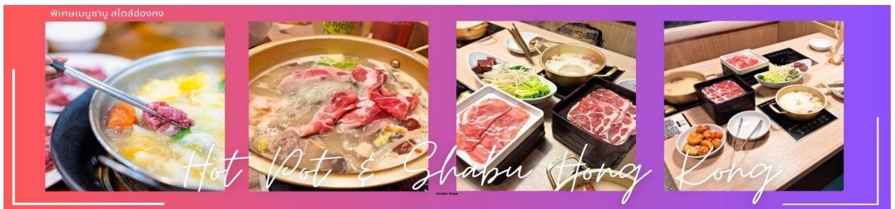
Hot Pot & Shabu Hong Kong

กลางวัน ๑๐ บริการอาหารกลางวัน ณ ภัตตาคาร พิเศษเมนูชาบู สไตส์ฮ่องกง (5)