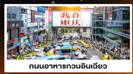
ถนนอาหารกวนอันเฉียว