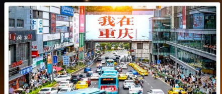
ถนนอาหารกวนอันเฉียว