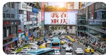
ถนนอาหารกวนอันเฉียว