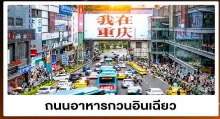
ถนนอาหารกวนอันเจียว