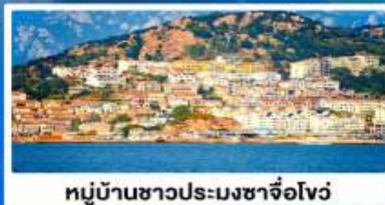
หมู่บ้านชาวประมงซาจื่อโจว