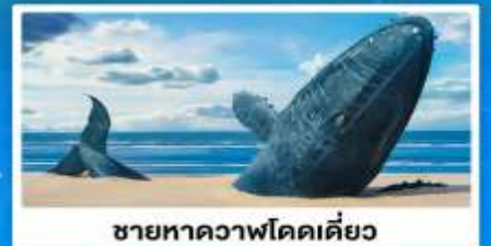
ชายหาดวาฬโดดเดี้ยว