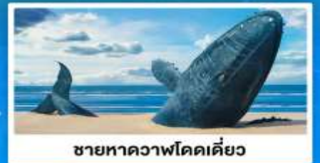
ชายหาดวาฬโดดเดี่ยว