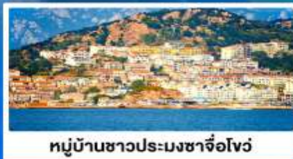
หมู่บ้านชาวประมงซาจื่อโจว