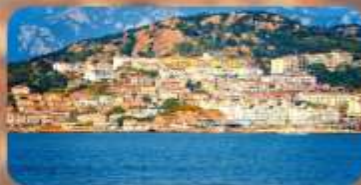
หมู่บ้านชาวประมงชาจื่อโจว