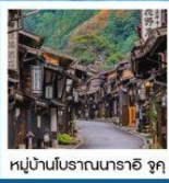
หมู่บ้านโบราณนารายิ จุกุ