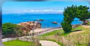
เกาะสี่เหลี่ยมเต่า