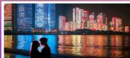
ชายหาดหมายเลข 3