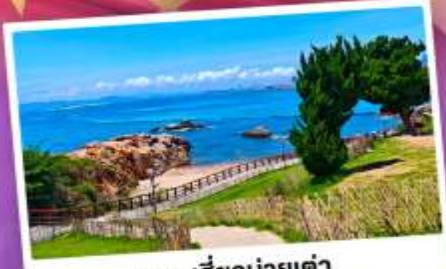
เกาะสี่งม่ายเต่า

เที่ยวชิงเต่า เมืองทะเลสุดชิล ครบทั้งกิน เที่ยว ถ่ายรูป