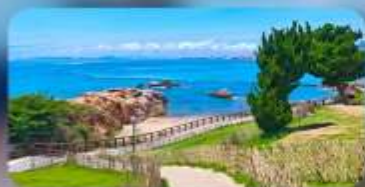
เกาะสี่เหลี่ยมเต่า