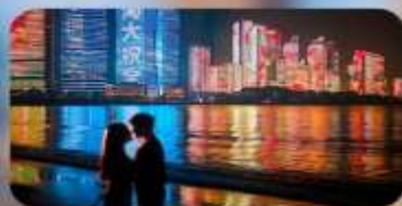
ชายหาดหมายเลข 3