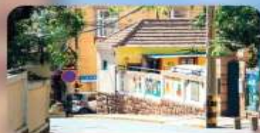
ถนนหลงเจียง