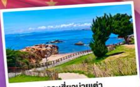
เกาะสี่งม่ายเต่า

เที่ยวชิงเต่า เมืองทะเลสุดชิล ครบทั้งกิน เที่ยว ถ่ายรูป