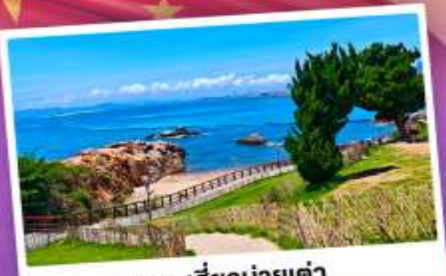
เกาะสี่ข่านายเต่า

เที่ยวชิงเต่า เมืองทะเลสุดชิล ครบทั้งกิน เที่ยว ถ่ายรูป