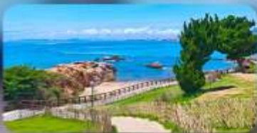
เกาะสี่เหลี่ยมเต่า