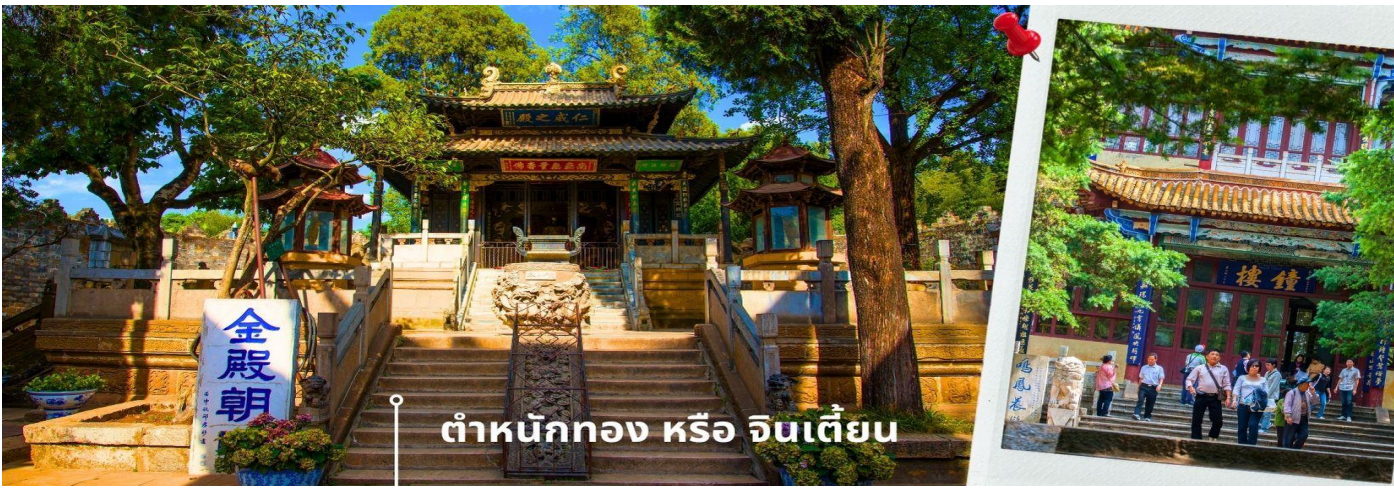
ดำหนักทอง หรือ จินเตี้ยน

เช้า รับประทานอาหารเช้า ณ ห้องอาหารโรงแรม (1) นำท่านเยี่ยมชม ดำหนักทอง หรือ จินเตี้ยน (The Golden Temple Park | Jindian park) ( ไม่รวมค่ารถแบตเตอร์รี่ 10 หยวน/ท่าน ) โบราณสถานสำคัญของมณฑลยูนนาน ที่ได้รับการปกป้องดูแลโดยรัฐบาลจีน ตั้งอยู่บริเวณเชิงเขาหมิงเฟิง ล้อมรอบด้วยแนวกำแพงและหอคอยเหมือนเป็นป้อมปราการ ดำหนักทองถูกเรียกตามลักษณะอาคารที่มีสีทองอร่าม จากทองเหลืองในส่วนของผนังและหลังคา รวมกว่า 200 ตัน โดยถือเป็นสิ่งปลูกสร้างด้วยสัมฤทธิ์ที่ใหญ่ที่สุดของจีน ภายในมีรูปปั้นทองโดยมีเงินอยู่ (เสวียนอู่) เทพเจ้าลัทธิเต๋าเป็นองค์ประธาน