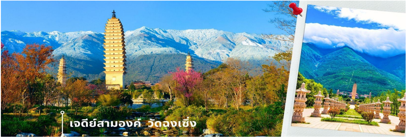
เจดีย์สามองค์ วัดฉงเซิ่ง

จากนั้นผ่านชม เจดีย์สามองค์ สัญลักษณ์ของเมืองต้าหลี่ ตั้งอยู่ภายใน วัดฉงเซิ่ง (Chongsheng Temple) วัดเก่าแก่ที่สร้างขึ้นเมื่อศตวรรษที่ 9 นับว่าเป็นหนึ่งในเจดีย์ที่สูงที่สุดในประเทศจีน อีกทั้งยังมีความศักดิ์สิทธิ์เป็นอย่างมาก ว่ากันว่าเป็นหนึ่งในสิ่งก่อสร้างเพียงไม่กี่แห่งที่ไม่ถูกทำลายจากเหตุการณ์แผ่นดินไหวในเมืองต้าหลี่เมื่อปี ค.ศ. 1925 จึงกลายเป็นสถานที่เคารพศรัทธาของชาวต้าหลี่เป็นอย่างมาก