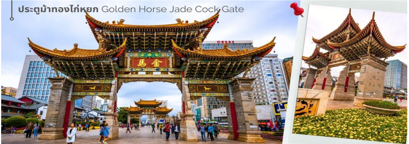
ประตูม้าทองไก่อ่หยก Golden Horse Jade Cock Gate

ชม ชุมประตุม้าทอง และ ชุมประตูไก่อ่หยก ซึ่งภาษาจีนเรียกว่าจินหมา และปี้จี้ จิ้งเอาค่าย่อ จินปี้ มาชานานนามถนน แห่งนี้ ชุมม้าทองและไก่อ่หยก มีอายุร่วม 400 ปี สร้างขึ้นในสมัยราชวงศ์หมิง ในถนนย่านการค้าแห่งนี้ เป็นแหล่งเสื้อผ้า แบรนด์เนมทั้งของจีนและต่างประเทศ รวมทั้งเครื่องประดับ อัญมณี ร้านเครื่องดื่ม และร้านขายของที่ระลึกมากมาย