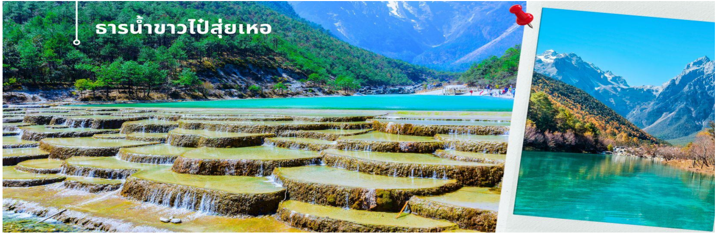
ธารน้ำขาวไปสู่ยเหอ

นำท่านชมธารน้ำขาวไปสู่ยเหอ หรือ ทะเลสาบไปสู่ยเหอ (รวมค่าบริการรถแบดเตอร์) ทะเลสาบสีเทอร์ควอยซ์ตัดกับวิวต้นไม้ท่ามกลางขุนเขาแห่งหุบเขาพระจันทร์สีน้ำเงิน ฉากของภูเขาหิมะมังกรหยก มีน้ำตกหินปูนชั้นบันไดขนาดเล็กลดหลั่นลงมาอย่างสวยงาม น้ำที่ไหลผ่านหุบเขานี้คือน้ำที่ละลายจากหิมะบนยอดเขาหิมะมังกรหยก เนื่องจากจุดนี้มีทิวทัศน์ที่สวยงามมีฉากหลังคือภูเขาหิมะมังกรหยกมีน้ำตกและแม่น้ำกึ่งทะเลสาบจึงเป็นที่นิยมของนักท่องเที่ยวช่างภาพและคู่รักเป็นอย่างมาก อีสระเก็บภาพประทับใจตามอัธยาศัย