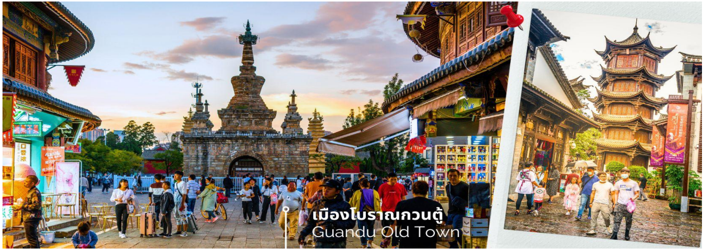
เมืองโบราณกวนตุ๋ Guandu Old Town

เช้า 🎯 รับประทานอาหารเช้า ณ ห้องอาหารโรงแรม (13) นำท่านชมบรรยากาศ เมืองโบราณกวนตุ๋ (Guandu Old Town) เป็นหนึ่งในต้นกำเนิดของวัฒนธรรมยูนนาน และยังถือเป็นหนึ่งในภูมิทัศน์ทางประวัติศาสตร์และวัฒนธรรม ที่สำคัญของเมืองคุนหมิง เมืองโบราณแห่งนี้ยังคงเป็นศูนย์กลางทางการค้าและคมนาคมที่สำคัญ ในอดีตเคยเป็นหมู่บ้านชาวประมงในสมัยราชวงศ์ถัง เมืองกวนตุ๋ยังเป็นเมืองแรกๆ ที่ศาสนาพุทธทางนิกายเถรวาทได้เริ่มเผยแผ่เข้ามาในดินแดนยูนนาน