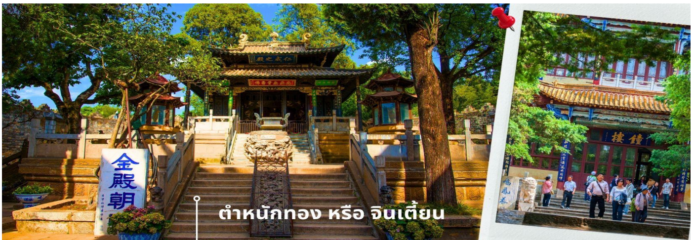
ดำหนักทอง หรือ จินเตี้ยน