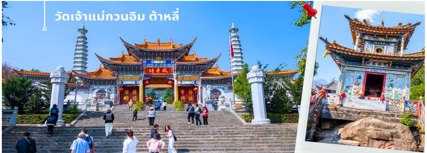
วัดเจ้าแม่กวนอิม ต้าหลี่

เช้า ๑๐ รับประทานอาหารเช้า ณ ห้องอาหารโรงแรม (4) นำท่านชม วัดเจ้าแม่กวนอิม (ใช้เวลาเดินทาง 30 นาที) ตามตำนานเล่าว่าเจ้าแม่กวนอิมได้แปลงกายเป็นหญิงชราแบกก้อนหินใหญ่ไว้บนหลังเพื่อให้ทหารของฝ่ายตรงข้ามได้เห็นเมื่อทหารฝ่ายศัตรูได้เห็นว่ามีแม่แต่หญิงชรายังแข็งแรงถึงเพียงนี้ ถ้าเป็นคนวัยหนุ่มสาวจะต้องมีพลังกำลังมากมายก่ายกองที่จะต่อสู้ จึงทำให้ไม่ทำการเข้าโจมตี เมืองและถอยทัพกลับไป ชาวเมืองจึงสร้างวัดแห่งนี้ขึ้นในสมัยราชวงศ์ถัง ซึ่งถือว่าเป็นวัดที่มีประติมากรรมยอดเยี่ยมแห่งหนึ่งในต้าหลี่