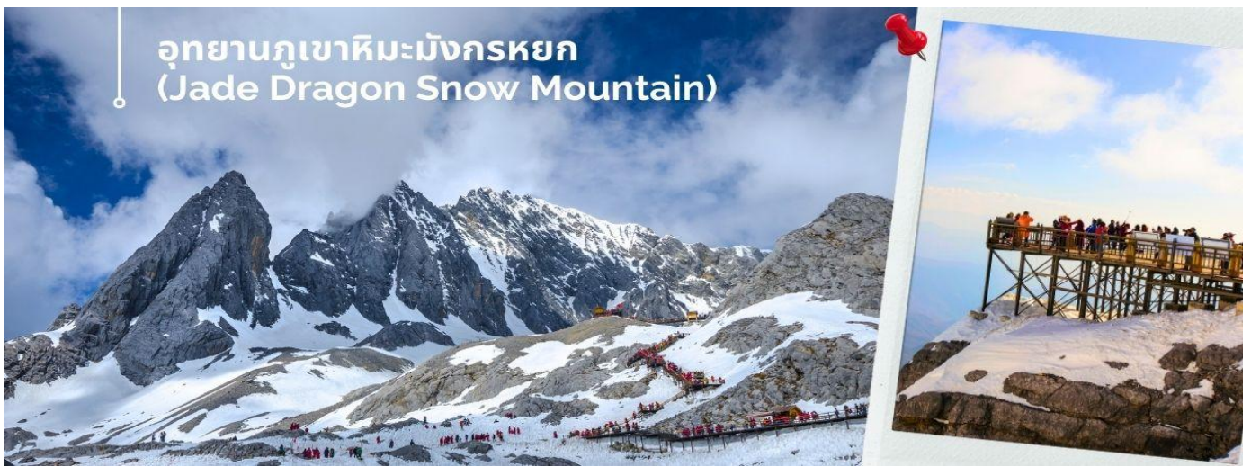
อุทยานภูเขาหิมะมังกรหยก (Jade Dragon Snow Mountain)

นำท่านชม อุทยานภูเขาหิมะมังกรหยก (Jade Dragon Snow Mountain) (รวมค่ารถเช่าใหญ่ ขึ้น-ลง) สู่จุดชม วิว ภูเขาหิมะมังกรหยก สูงจากระดับน้ำทะเล 4,506 เมตร ตั้งอยู่ในเขตปกครองตนเอง Yulong Naxi เมืองลี่เจียง มณฑลยูนนาน เป็นหนึ่งในสถานที่ท่องเที่ยวระดับ 5A เป็นอุทยานธรณีธารน้ำแข็งแห่งชาติ ครอบคลุมพื้นที่ 415 ตาราง กิโลเมตร และภูเขามีสลักษณะเป็นลูกคลื่นและมีลักษณะคล้ายมังกรเงินที่บินได้ตั้งนั้นจึงได้ชื่อว่าภูเขาหิมะมังกรหยก ยอดเขาหลัก ซ่านจี้โต่ว อยู่สูงจากเหนือระดับน้ำทะเล 5,596 เมตร ล้อมรอบด้วยเมฆและหมอกตลอดทั้งปี เป็นยอด เขาบริสุทธิ์ที่ไม่มีใครพิชิตได้ ภูเขาหิมะมังกรหยกเป็นหนึ่งในจุดชมวิวที่มีชื่อเสียงในลี่เจียงและเป็นภูเขาศักดิ์สิทธิ์ในใจ ของชาวนาซี มียอดเขาทั้งหมด 13 ยอด อุดมไปด้วยทรัพยากรการท่องเที่ยวทางธรรมชาติ และสามารถแบ่งออกเป็น