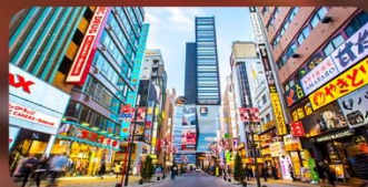
ซ้อปบั้งชินจุกุ