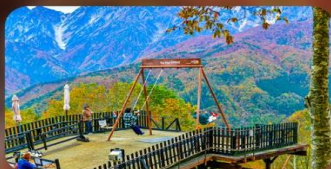
ฮาคุบะอิวาทากะ