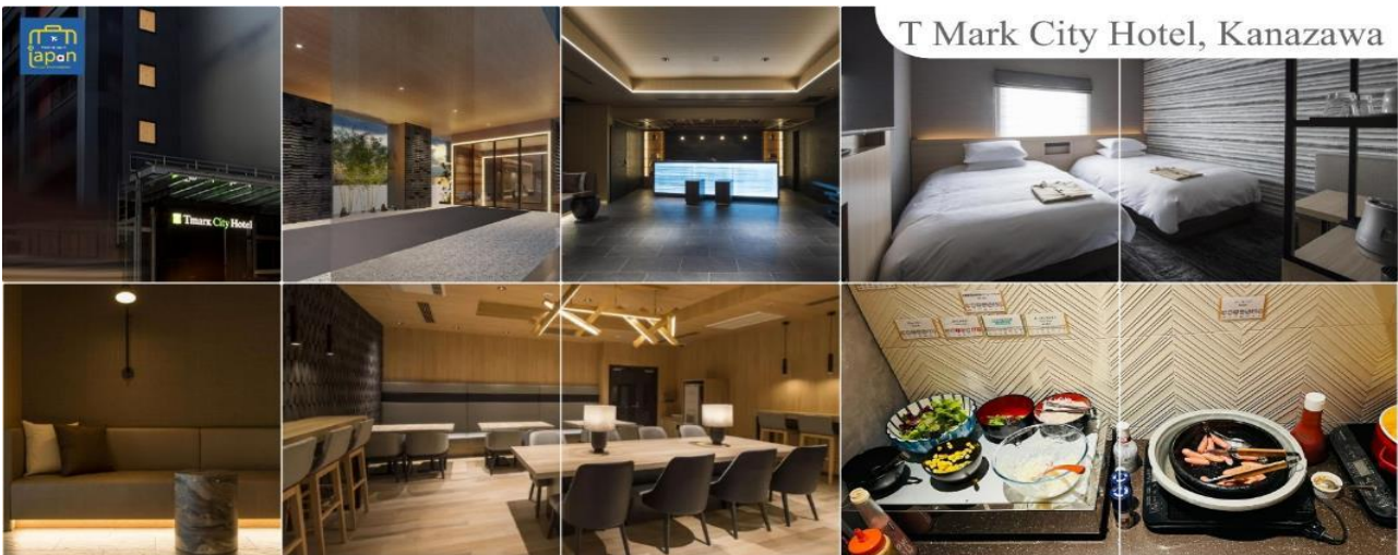
T Mark City Hotel, Kanazawa

T MARK CITY HOTEL, KANAZAWA หรือเทียบเท่าระดับเดียวกัน