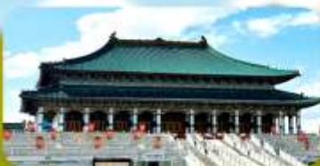
พระราชวังต้องห้ามออร์ดอส