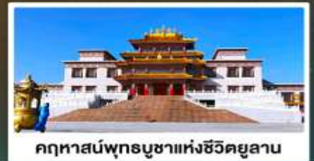
คฤหาสน์พุทธบูชาแห่งชีวจียูลาน