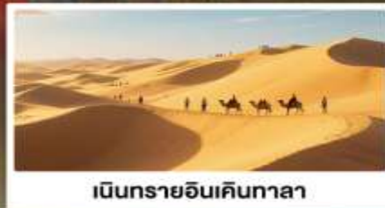
เป็นทรายอินเคินทาลา