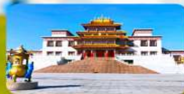
คฤหาสน์พุทธบูชาแห่งชีวิคยูลาน