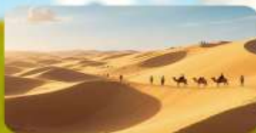
เนินทรายอินเคินทาลา