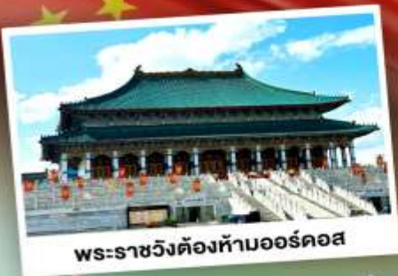
พระราชวังต้องห้ามออร์ดอส

ตะลุยเป็นทรายร้องเพลง แห่งมองโกเลียใน ชมวิวทุ่งหญ้าโล่งกว้างตัดขอบฟ้าคราม