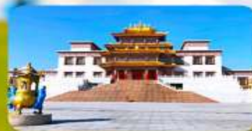
คฤหาสน์พุทธบูชาแห่งชีวิตอูลาน