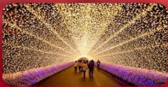
นาบานาโนะซาโตะ