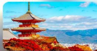
วัดคิโยมิชิ