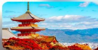
วัดคิโยมิชิ