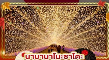
นาคานาโนะซาโต

"ชมความงามของฤดูใบไม้เปลี่ยนแล้ว" เที่ยวครบจบทุกไฮไลท์ โอซาก้า-โตเกียว พิเศษ!! บินเรือแบบ FULL SERVICE