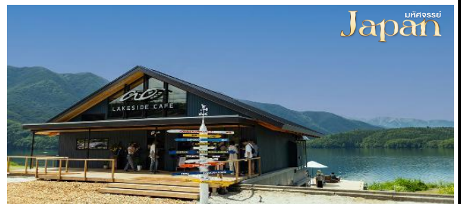
บหคจสสรย Japan

แวะชม Ao Lakeside Cafe คาเฟ่ และร้านอาหารยอดฮิตริมทะเลสาบอาโอไก ในเมืองโอมะจิ มีชื่อเสียงด้านวิวเทือกเขาเจแปนแอลป์ ที่สวยงามอลังการ บรรยากาศดีคล้ายนิวซีแลนด์ สามารถมองเห็นทัศนียภาพของภูเขาและทะเลสาบที่เปลี่ยนไปตามฤดูกาล