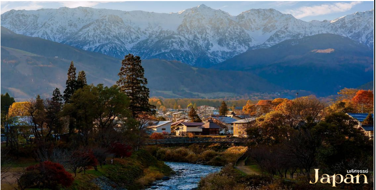
บหคจสสรย Japan

ชม โออิตะ ปาร์ค เป็นสวนสาธารณะขนาดเล็กที่เงียบสงบตั้งอยู่ในหมู่บ้านฮาคุบะ จังหวัดนากาโนะ สวนสวย น้ำใส ซึ่งไฮไลท์ของที่สวน คือ มีแม่น้ำฮิเมะคาวะ ไหลผ่าน ชมวิวสะพานแขวนไม้ และฉากหลังเป็นวิวของเทือกเขาแอลป์