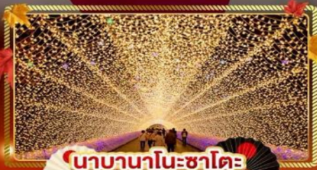
นาคานาโนะซาโต

"ชมความงามของฤดูใบไม้เปลี่ยนแล้ว" เที่ยวครบจบทุกไฮไลท์ โอซาก้า-โตเกียว พิเศษ!! บินเรือแบบ FULL SERVICE