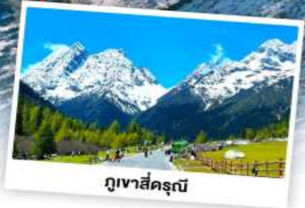
กุเวาสีครุณี

เดินทางโดย: สายการบินเฉิงตูแอร์ไลน์ (EU)