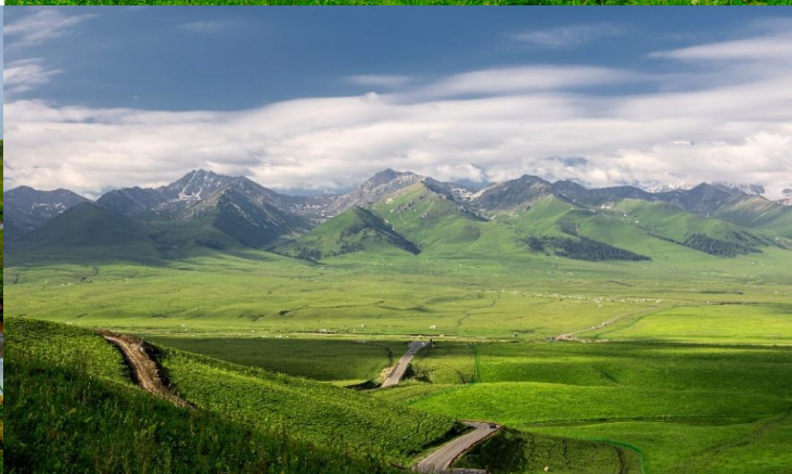
(Yining/Ghulja) (ใช้เวลาเดินทางประมาณ 4 ชั่วโมง)