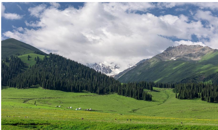
นำท่านเดินทางกลับสู่ เมืองอีหนิง