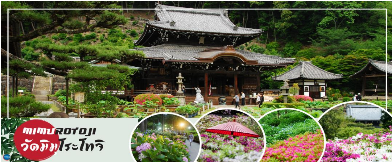
mimurotoji วัดมิมุโรโตะจิ

วันที่สอง ท่าอากาศยานนานาชาติคันไซ โอซาก้า – เมืองเกียวโต – วัดมิมุโรโตะจิ – เมืองนาโกย่า – แฉัง ดริ้ม เอ๊าท์เล็ท