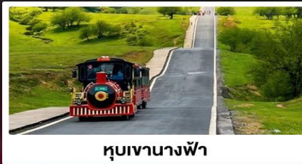
หุบเขานางฟ้า