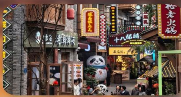
หมู่บ้านสี่ป่าที่