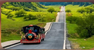
หุบเจนางฟ้า