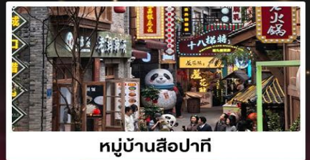
หมู่บ้านสี่牌坊