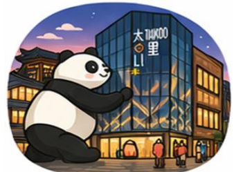
ถนนคนเดินไท่กู๋หลี่ (Taikoo Li)

จากนั้นอิสระท่าน ถนนคนเดินชุนซีหลู่ ย่านช้อปปิ้งชื่อดังและคึกคักที่สุดของเฉิงตู เต็มไปด้วยห้างสรรพสินค้า ร้านแบรนด์ดัง ร้านอาหาร และสตรีทฟู้ด เหมาะสำหรับช้อปปิ้งและสัมผัสวิถีชีวิตคนเมือง และ ถนนคนเดินไท่กู๋หลี่ แหล่งช้อปปิ้งไลฟ์สไตล์สุดทันสมัย ผสมผสานสถาปัตยกรรมจีนโบราณกับดีไซน์โมเดิร์นอย่างลงตัว รายล้อมด้วยร้านค้าแบรนด์ดัง คาเฟ่ และมุมถ่ายรูปสวยๆ มากมาย