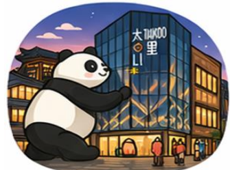
ถนนคนเดินไท่กู๋หลี่ (Taikoo Li)

จากนั้นอิสระท่าน ถนนคนเดินชุนซีลู่ ย่านช้อปปิ้งชื่อดังและคึกคักที่สุดของเฉิงตู เต็มไปด้วยห้างสรรพสินค้า ร้านแบรนด์ดัง ร้านอาหาร และสตรีทฟู้ด เหมาะสำหรับช้อปปิ้งและสัมผัสวิถีชีวิตคนเมือง และ ถนนคนเดินไท่กู๋หลี่ แหล่งช้อปปิ้งไลฟ์สไตล์สุดทันสมัย ผสมผสานสถาปัตยกรรมจีนโบราณกับดีไซน์โมเดิร์นอย่างลงตัว รายล้อมด้วยร้านค้าแบรนด์ดัง คาเฟ่ และมุมถ่ายรูปสวยๆ มากมาย