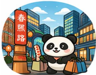
ถนนคนเดินชุนซีลู่ (Chunxi Road)

จากนั้นอิสระท่าน ถนนคนเดินชุนซีลู่ ย่านช้อปปิ้งชื่อดังและคึกคักที่สุดของเฉิงตู เต็มไปด้วยห้างสรรพสินค้า ร้านแบรนด์ดัง ร้านอาหาร และสตรีทฟู้ด เหมาะสำหรับช้อปปิ้งและสัมผัสวิถีชีวิตคนเมือง และ ถนนคนเดินไท่กู๋หลี่ แหล่งช้อปปิ้งไลฟ์สไตล์สุดทันสมัย ผสมผสานสถาปัตยกรรมจีนโบราณกับดีไซน์โมเดิร์นอย่างลงตัว รายล้อมด้วยร้านค้าแบรนด์ดัง คาเฟ่ และมุมถ่ายรูปสวยๆ มากมาย