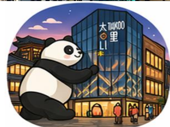
ถนนคนเดินไท่กู๋หลี่ (Taikoo Li)

จากนั้นอิสระท่าน ถนนคนเดินชุนซีหลู่ ย่านช้อปปิ้งชื่อดังและคึกคักที่สุดของเฉิงตู เต็มไปด้วยห้างสรรพสินค้า ร้านแบรนด์ดัง ร้านอาหาร และสตรีทฟู้ด เหมาะสำหรับช้อปปิ้งและสัมผัสวิถีชีวิตคนเมือง และ ถนนคนเดินไท่กู๋หลี่ แหล่งช้อปปิ้งไลฟ์สไตล์สุดทันสมัย ผสมผสานสถาปัตยกรรมจีนโบราณกับดีไซน์โมเดิร์นอย่างลงตัว รายล้อมด้วยร้านค้าแบรนด์ดัง คาเฟ่ และมุมถ่ายรูปสวยๆ มากมาย