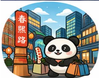
ถนนคนเดินชุนซีหลู่ (Chunxi Road)

จากนั้นอิสระท่าน ถนนคนเดินชุนซีหลู่ ย่านช้อปปิ้งชื่อดังและคึกคักที่สุดของเฉิงตู เต็มไปด้วยห้างสรรพสินค้า ร้านแบรนด์ดัง ร้านอาหาร และสตรีทฟู้ด เหมาะสำหรับช้อปปิ้งและสัมผัสวิถีชีวิตคนเมือง และ ถนนคนเดินไท่กู๋หลี่ แหล่งช้อปปิ้งไลฟ์สไตล์สุดทันสมัย ผสมผสานสถาปัตยกรรมจีนโบราณกับดีไซน์โมเดิร์นอย่างลงตัว รายล้อมด้วยร้านค้าแบรนด์ดัง คาเฟ่ และมุมถ่ายรูปสวยๆ มากมาย