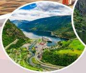
นั้รงรดไฟสายโรแมนติก “Flamsbana”