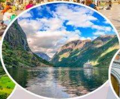
ล่องเรือ "Nærøyfjord"