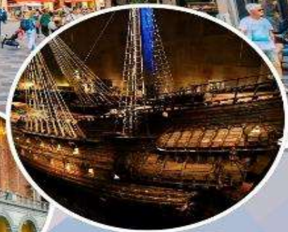
เข้าชม "พิพิธภัณฑ์เรือวาซา"