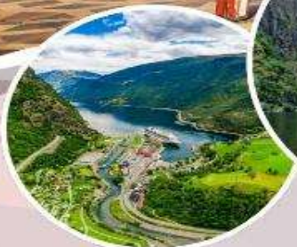
นั้รงรดไฟสายโรแมนติก "Flamsbana"