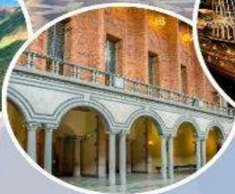
เข้าชมศาลาว่าการ กรุงสต็อกโฮล์ม