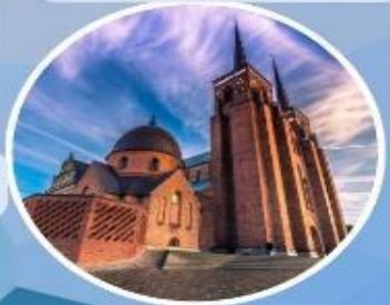
เข้าชม "มหาวิหารรอสโคลด์"