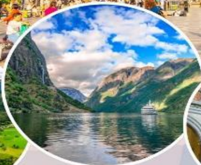
ล่องเรือ "Nærøyfjord"