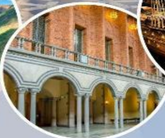
เข้าชมศาลาว่าการ กรุงสต็อกโฮล์ม