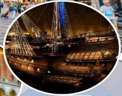
เข้าชม "พิพิธภัณฑ์เรือวาซา"