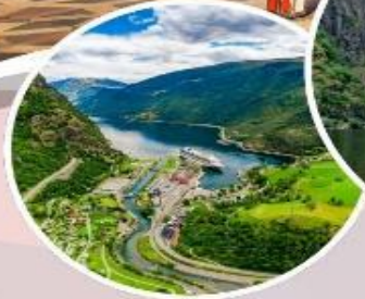
นั่งรถไฟสายโรแมนติก "Flamsbana"