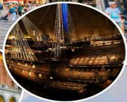
เข้าชม “พิพิธภัณฑ์เรือวาซา”