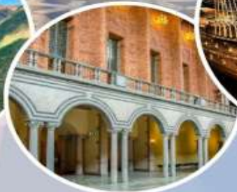
เข้าชมศาลาว่าการ กรุงสต็อกโฮล์ม