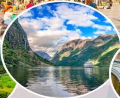
ล่องเรือ “Nærøyfjord”