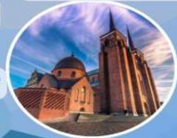
เข้าชม “มหาวิหารรอสโคลด์”