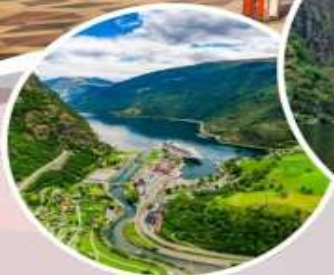
นั่งรถไฟสายโรแมนติก “Flamsbana”