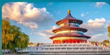
หอสักการะฟ้าเทียนถาน