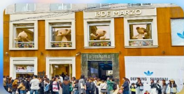
ถนนอันฟู