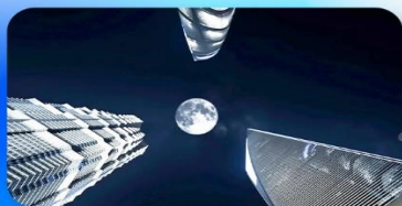
ลู่เจียสุ่ย