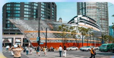
เรือทลยส์วิตตอง